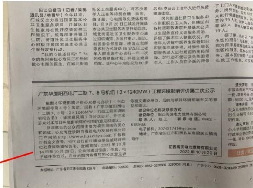
图 3.2-2 本项目征求意见稿登报公示照片（2022.10.20）