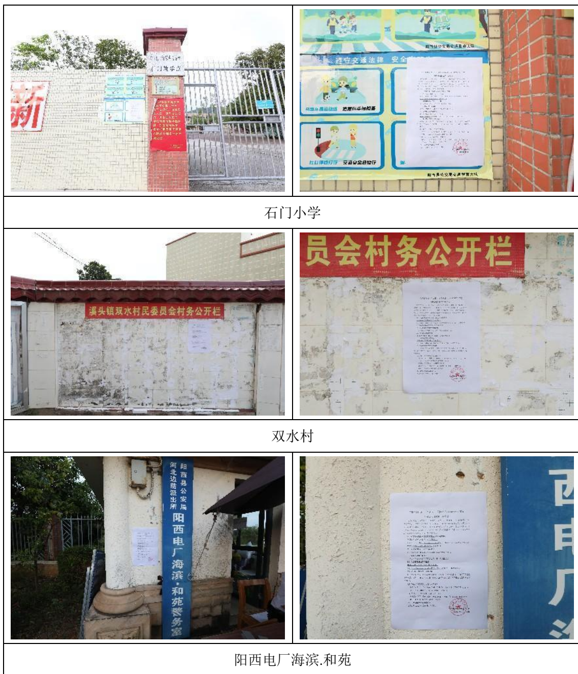
图 3.2-4 2022 年 10 月张贴公示相关图片